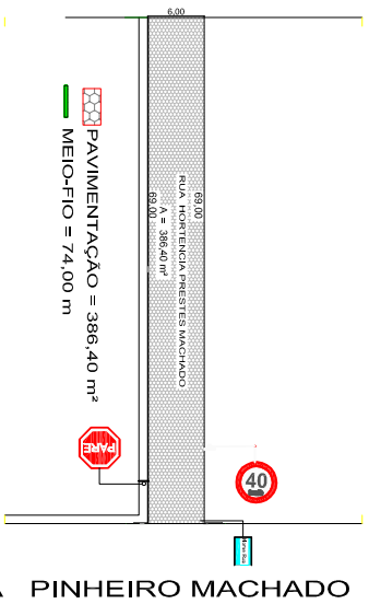
03 Projeto Sinalização Pavimentação Rua Hortencia Prestes Machado